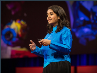
Why we need to imagine different futures Ted talk de Anab Jian